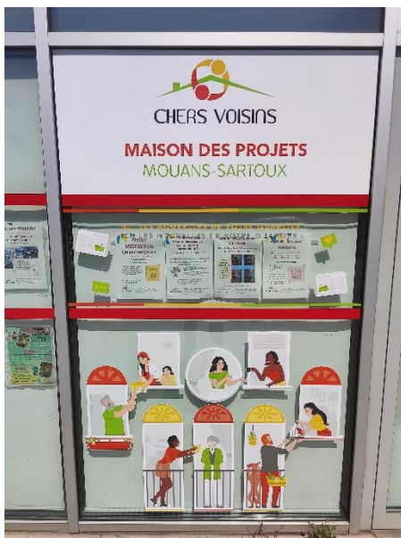
Façade de la Maison des Projets de Mouans-Sartoux - 2023