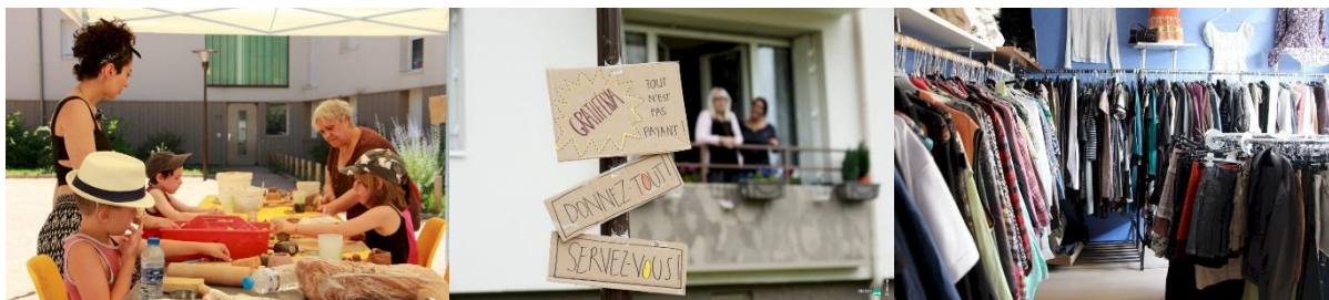
Chers Voisins® à Saint-Germain-au-Mont-d'Or - Récipro-Cité et 1001 Vies Habitat

Le projet Chers Voisins® a permis de réduire le turn-over et la vacance des appartements, de tisser des liens entre les habitants de cette résidence sociale et le reste de la commune, de réduire les charges locatives grâce à l'entretien collectif des espaces communs et des espaces verts.