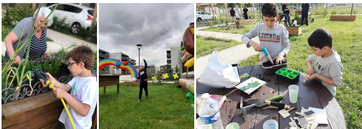
Chers Voisins® à Lieusaint : atelier jardinage et fête de l'été 2023 - Récipro-Cité et 1001 Vies Habitat

On peut y trouver un espace cuisine-bar, une friperie, des ateliers beauté, sportifs, jardinage, tricot, jeux de société, slam, des coins lecture, participer à des rendez-vous imaginés par les habitants comme les cafés-poussettes. Des anniversaires, des fêtes familiales peuvent y être organisés. Des résidents référents peuvent disposer des clés au même titre que le gestionnaire-animateur, et l'ouvrir en fonction des besoins, en dehors des horaires d'ouverture définis. C'est un véritable espace de vie, de partage et d'entraide où le voisinage est responsable, actif et solidaire.