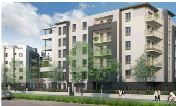
La résidence Botticelli – Bruno Storai / Linkcity Ile-de-France / Bouygues Immobilier / 1001 Vies Habitat

Vie Partagée de la Caisse Nationale de la Solidarité pour l'Autonomie (CNSA) et du Conseil départemental de Seine-Saint-Denis.