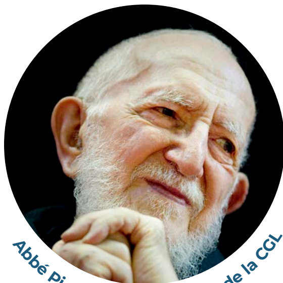
Abbé Pierre, père fondateur de la CGL