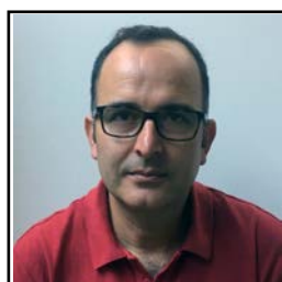
BOUYAALA Khalid Les JARDINS de CLAUDEL 13 500 MARTIGUES