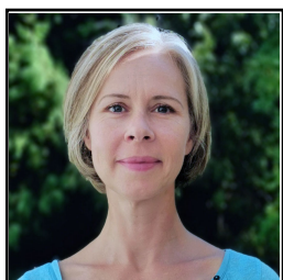
LESSER Myriam VILLA HORTUS 13008 MARSEILLE