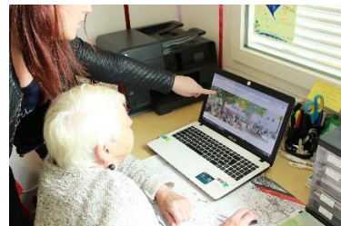
Chers Voisins® Fête inter-sites - Chers Voisins® à Aix-les-Bains- Chers Voisins® à Lieusaint