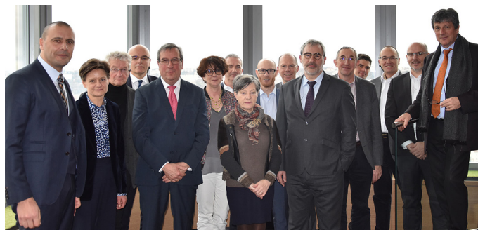
Le Conseil d'Administration de l'AURA-HLM lors de l'Assemblée Générale du 19 janvier 2018.

En tant qu'organisation professionnelle, l'AURA-HLM est constituée d'un Conseil d'Administration composé de directeurs généraux d'organismes du logement social. Sa gouvernance est plurielle, marquée par une volonté d'avoir, au sein de l'organe décisionnel de l'Association, des représentants de tous les territoires (départements) et pôles d'influence (Métropoles) régionaux, ainsi que de l'ensemble des familles Hlm.